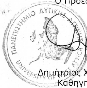
Δημήτριος Χανιώτης Καθηγητής